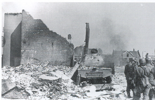
De P-178 Panhard pantserwagen van 5.GRDI, die in de Dorpstraat van Zevenbergschen Hoek slachtoffer werd van Duitse bommen. Er vielen vijf Franse doden bij deze luchtaanval in het dorp. Ook burgerslachtoffers en veel schade aan het dorp. Het betekende het einde van alle Franse aspiraties rond Moerdijk.

Het totale gebrek aan oorlogsrealisme en het aanstellen van een absolute non-strateg als opperbevelhebber hadden ertoe geleid dat men geen idee had van de stand van zaken. Men wachtte af. Men voer blind. Den Haag wist niet dat op 11 mei in de avond het Belgische Leger op de volle terugtocht naar de KW-Stelling was, dat een sterk Duits pantserkorps nabij Hannut in België het Franse cavaleriekorps bedreigde en dat de Fransen slechts hun voorgenomen verdediging tot de Mark inrichtten en de sector langs de Maas geheel open lieten. Op 12 mei in de ochtend begon de SS-V Division zich bij 56.ID in de sector oost van Tilburg aan te sluiten en werd de Franse voorverdediging teruggedrongen met gevechten rond Hilvarenbeek, Hooge Mierde en Diessen tot gevolg. Het Franse voornemen om Breda hardnekkig te verdedigen, dat nog in de ochtend van 12 mei leidde tot het bevel de stad te evacueren, was in de avond al teruggedraaid. Den Haag wist dus niet dat de Duitsers geen Fransman op hun pad vonden naar Moerdijk. Ze wisten wel dat Nederlandse troepen vermoedelijk niets meer deden, want daar hadden ze zelf voor gekozen. Winkelman hield zich blind en doof voor informatie van Duitse progressie, maar onderkende kennelijk evenmin dat een Franse redding van Moerdijk alle Duitse kracht op hen zou laden en dus in Frans nadeel zou zijn. Aldus bleef Winkelman vertrouwen op een reddingsboot die nooit te water zou gaan.