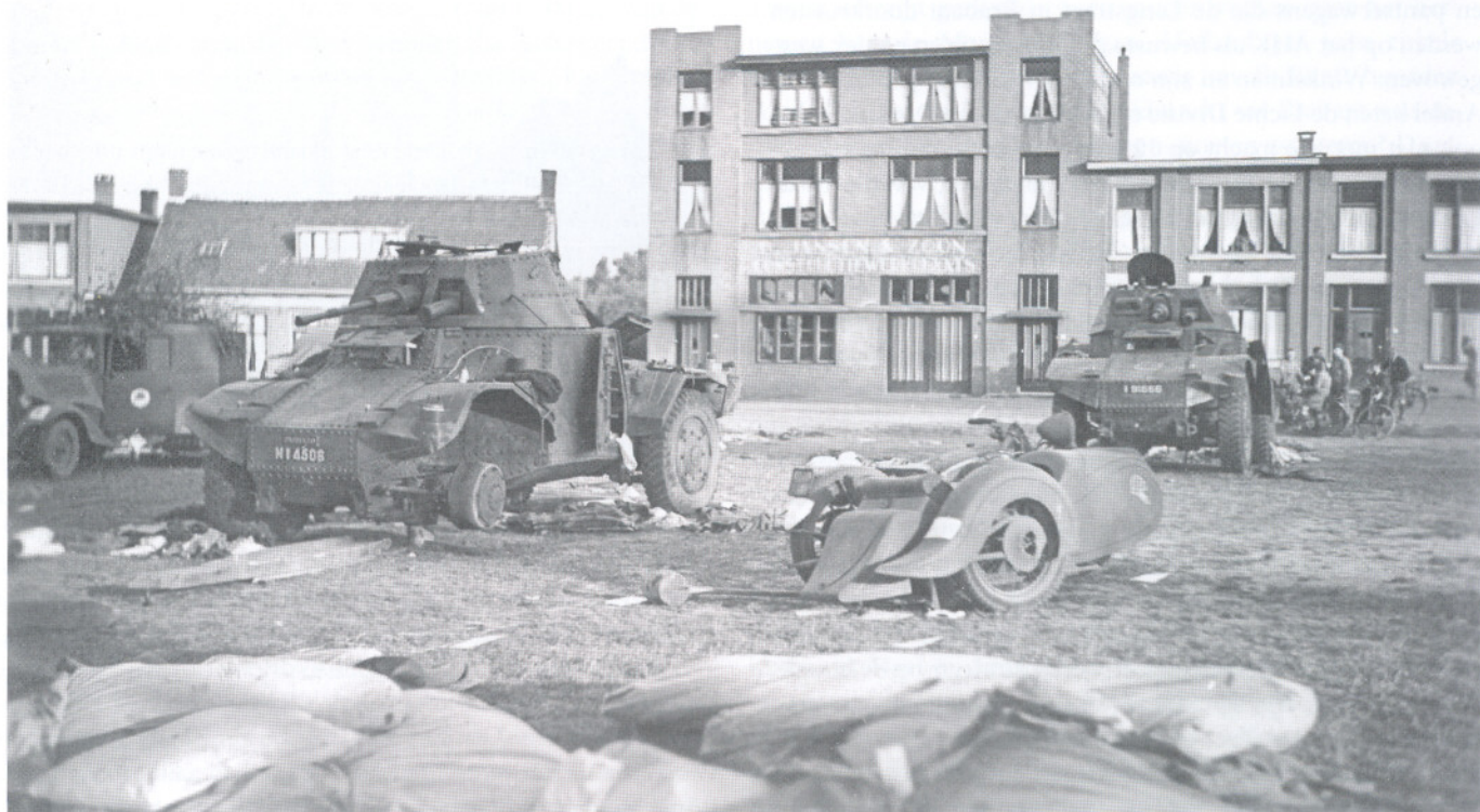
Verlaten pantserwagens van 12.GRDI in Bergen op Zoom, achtergelaten nadat de stad omsingeld werd door SS-troepen en men te voet trachtte te ontsnappen. De meeste werden alsnog gevangen genomen.

Nederland maakte in de periode van 1938-1940 de merkwaardige keuze om te kiezen voor een hardnekkige defensie in het oosten van Brabant, in plaats van op een linie Den Bosch-Tilburg, die voordien bij vele Generale Staf officieren al de voorkeur genoot. In de periode Reijnders werd echter nog wel